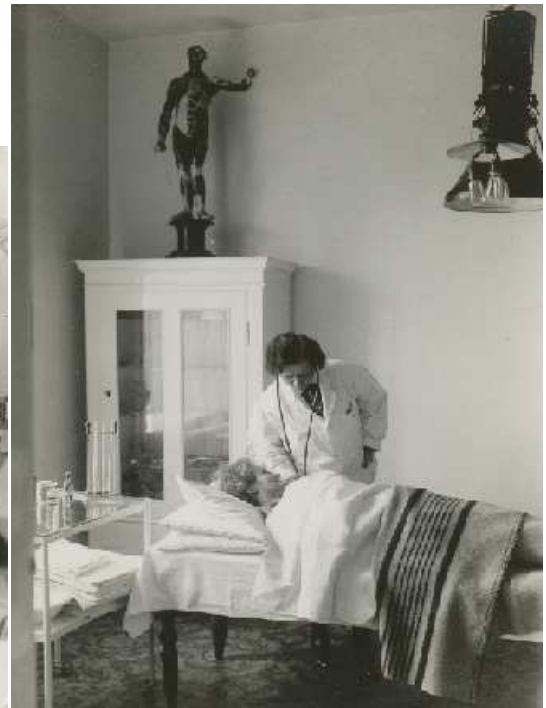
Mandlige og kvindelige sygeplejere i gang med nogle af de behandlinger, som blev tilbudt på Frydenstrand.

Byggesagen om Frydenstrand vidner om, hvorledes ikke kun hovedbygningen, men også hele området konstant blev udviklet, udvidet og bygget om, så badesanatoriet leverede den bedst mulige standard indenfor de forskellige behandlinger. Der blev foretaget store ombygninger på hovedbygningen stort set hvert andet år. Særligt i slutningen af 1920'erne og op igennem 1930'erne blev der blandt andet installeret nye baderum med nye ventilations-, lys- og afløbsforhold. Efterfølgende blev der bygget nye toiletbygninger, gymnastikbygning, glaspavillion, diverse tilbygninger og facadeændringer, foruden fornyet staldbygninger, gartneri, park, tennisbane og diverse udhuse. Frydenstrand var i sandhed et storslået projekt i konstant rivende udvikling.